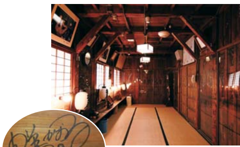
趣のある楽屋内部。壁面には、出演者のサインが数知れず残っている。