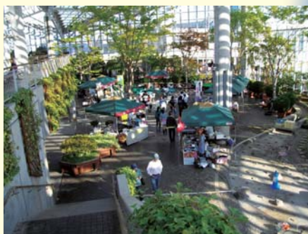
ガラス張りのセリオンリスタは一年中緑に包まれている。