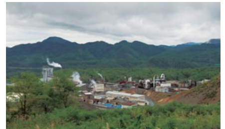
24時間眠らない工場の町。かつて煙害で黒い丘に変貌した土地に植栽されたニセアカシアが今では300万本にも増えた。