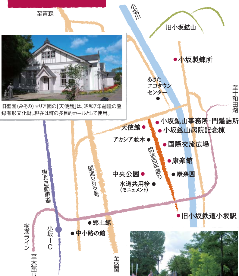
旧聖園(みその)マリア園の「天使館」は、昭和7年創建の登録有形文化財。現在は町の多目的ホールとして使用。