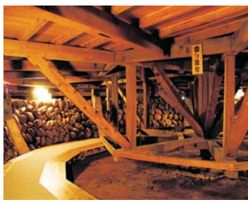
奈落。黒子が9.7mのろくろを回して舞台を回転させる。日本の「回り舞台」が発祥となり、世界中に広がった。