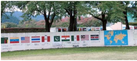
中央公園には現在約90カ国の国旗と研修員の名が残る。

助役自ら、アカシアの蜂蜜を手土産に上京し、松竹歌舞伎から小さなエージェントまで営業したのです」 演じる役者よりも観客の方が少なかつた頃もあった。 「職員は、通常業務の傍ら四チームに分かれて近頃の農協やマスコミを訪ね、康楽館のPRを続けました」 工夫と努力が功を奏し始め、静観していた住民の間にも美化活動や景観整備を行う協力者が増えていったという。 「フラワーボランティアの登録者は現在約1200人。16名のメンバーで休祭日などに、観光案内をするボランティアも行っています」 平成11年から毎年十数人(独)国際協力機構の海外研修員が製錬技術を学ぶために訪れる。 「町民が研修員のホストフレンドを引