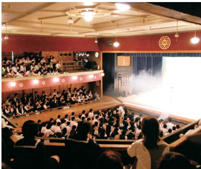
康楽館の客席は、純和風（畳）の棧敷席に洋風の板張り天井。客席には傾斜がついて見やすいように設計されている。