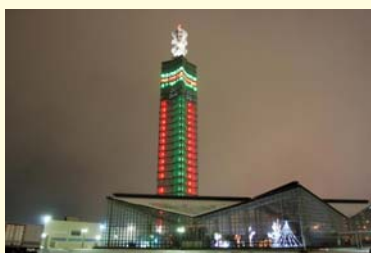
夜景百選に選ばれているセリオンタワー。

ま た、シンボルタワーのセリオンを中心に「みなとオアシスあきた」が形成され、昨年、「道の駅 あきた港」にも認定されました。展望台、レストラン、イベントなどのほか、セリオンリスタは、厳しい冬でも快適な屋内緑地として一年中緑と憩いの場を楽しめます。ぜひご家族お揃いでお出かけください。