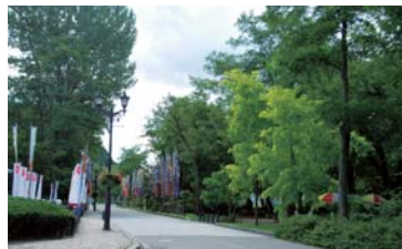
環境省「かおり風景100選」にも選ばれている「明治百年通り」。

伝え、親兄弟以上の絆を深めた。けがや病気で働けなくなった時は「友子」の仲間がその子息を育てたそうだ。そんな繋がりが今でも町民の心の奥に息づいているのかもしれない。 小坂町は、歴史の波に翻弄されながらも先人達の想いと生きる糧を引き継ぎ、それを活かしながら波乱の二世紀を見事に乗り越えてきた。 百年の時を超えて今なお現役で活躍する明治百年通りは、これからも町の歴史を語り継ぎながらたくましく、そしてしなやかに新しい時を刻んでいくに違いない。