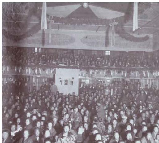
大正時代の康楽館観劇風景。