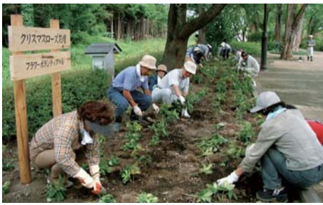
フラワーボランティアの会。クリスマスローズの植栽と手入れ、フラワーハンギングバスケットの設置を行う。