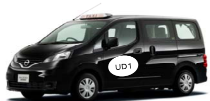
表示マーク(UDタクシーマーク)のイメージ

今回、このように3つの区分のUDタクシーを見分けられるようにする 3つの表示マーク(UDタクシーマーク) を募集します。 ※必ず3マーク1セットで応募してください。