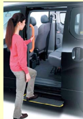
表示マーク(UDタクシーマーク)のイメージ