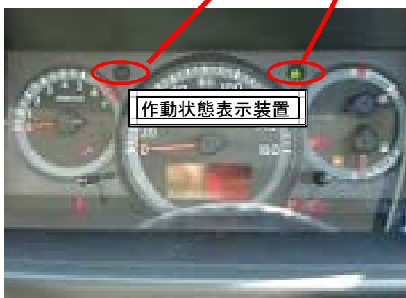
作動状態表示装置