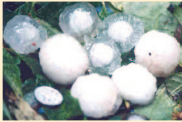
2000年5月25日に 千葉県に降ったピン ポン大のひょう (左下は1円玉)

ひょうは強い積乱雲に伴って発生し、そのほとんどは雷を伴います。気象庁の発表する雷注意報や気象情報ではひょうが降る可能性が大きい場合