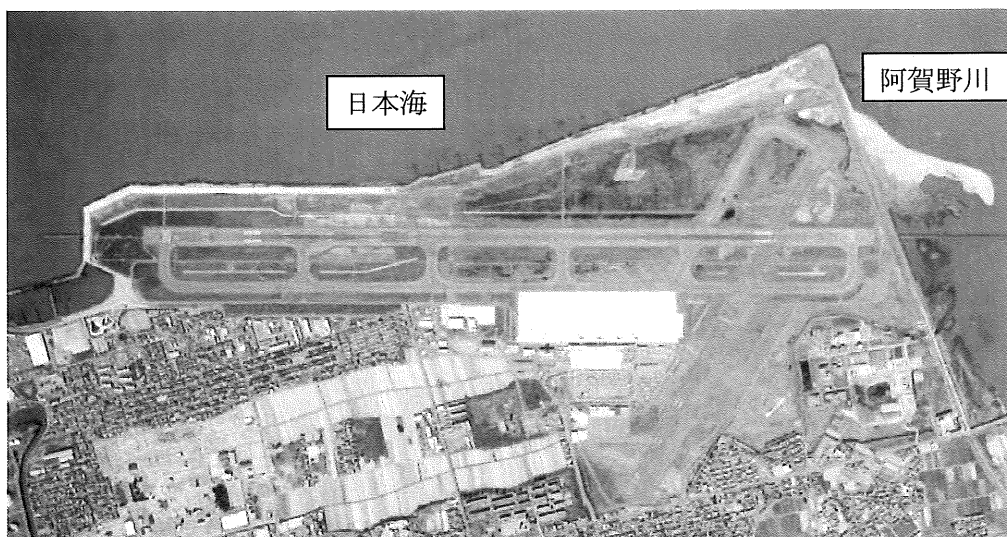
新潟空港の周辺の状況

本空港および周辺地域は、住宅地や工業地帯となっており、日本海と阿賀野川に面していることから、主に砂質地盤であることに加え、冬季の積雪、凍結、強風のため植物の生育環境としては厳しい条件下にある。