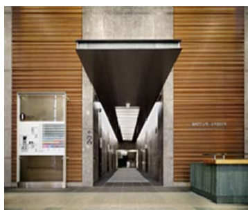
高松サンポート合同庁舎 エントランス