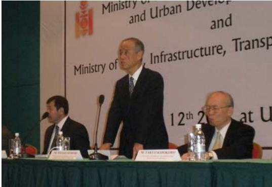
大森建設流通政策審議官