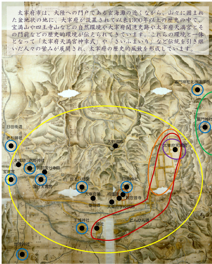
大野城太宰府旧蹟全図北一文化3（1806）年