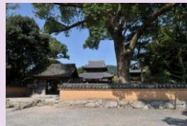
戒壇院の山門と土塀

趣のあるたたずまいで来訪者の目に触れる戒壇院の山門、土塀、東門の保存修理を行うことで歴史的風致の維持及び向上を図ります。