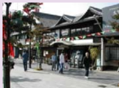
参道の歴史的建造物

天満宮門前の伝統家屋や市内に点在する歴史的建造物など太宰府の歴史的風致を形成している建造物の修理に助成を行い、良好な景観の形成と歴史的風致の維持向上を図ります。