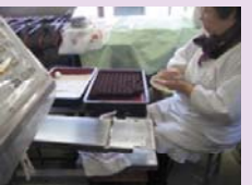
梅ヶ枝餅制作風景

天満宮の門前には、江戸時代から続く歴史的建造物が残り、名物となっている梅ヶ枝餅を始め参詣者をもてなす生業が続いています。また、恵比寿まつりや県指定無形文化財指定の鬼すべなどが伝統的生活として受け継がれています。