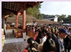
初詣で賑わう本殿前