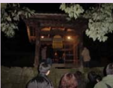
大晦日の観世音寺鐘楼

観世音寺の除夜の鐘は寒い中人々が静かに集まり、国宝に指定されている梵鐘をひと打ちつつ撞いていく行事です。古代の音色が観世音寺など歴史的建造物の間に響きます。