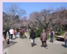
天満宮神苑での観梅

「万葉集」梅花の宴、菅原道真にまつわる飛梅伝説など、梅との縁は深く、江戸時代以降、梅を天満宮に献上し、植え、愛でる習慣は、厄除けの梅あげや市内いたる所への植樹に引き継がれています。