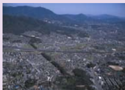
水城跡・大野城跡

さいふまいのり立寄り所である水城跡・大野城跡の修理・整備を行うことで「さいふまいのりにおける歴史的風致」の維持向上を図ります。