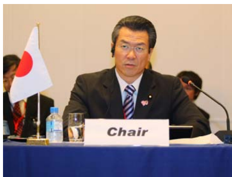
馬淵国土交通大臣（議長） によるご挨拶