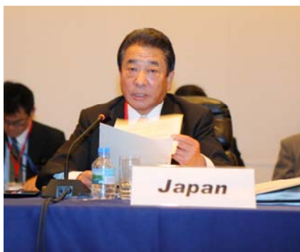
三井国土交通副大臣 によるご発表