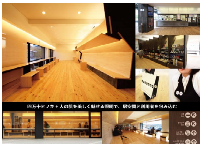
四万十ヒノキを積極的に活用した中村駅

改札口を撤去し駅内外の行き来を自由化、合わせて地場産ヒノキを積極的に活用した暖かみのある待合室を設置するなど、地方鉄道における駅づくりにおいて新しい感覚を取り入れながら、利用者の憩いの場や出会いの場となるよう中村駅を改装しました。さらに、駅構内の安心・安全性の向上や高齢者等にも分かりやすい案内表示とするなど、使いやすい駅へ改良したことが評価されたものです。