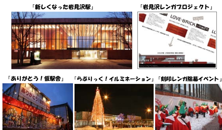
岩見沢駅を市民交流の拠点とし、各種イベントを開催

焼失した駅舎の再建にあたり、岩見沢複合駅舎建設をまちづくりの契機と捉え、各団体等との連携による各種イベントを開催しながら、2009年度「グッドデザイン大賞」を受賞するなど、市民連携によるまちづくりと市民協働による複合駅舎建設に取り組んだことが評価されたものです。