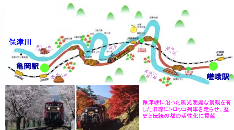
嵯峨野観光線の路線概要とトロッコ列車

JR嵯峨野線(嵯峨嵐山～馬堀間)が新線により複線電化されて以降、廃線となった施設を活かし、新しいスタイルの観光鉄道事業を20年前から展開しています。現在では年間90万人を超える利用者がおり、地域観光振興の貢献とモミジなどの植樹による自然再生への取り組み等を積極的に進めてきたことが評価されたものです。