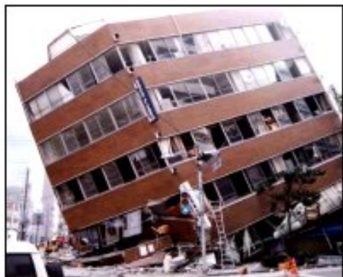
事務所ビル1, 2階の崩壊