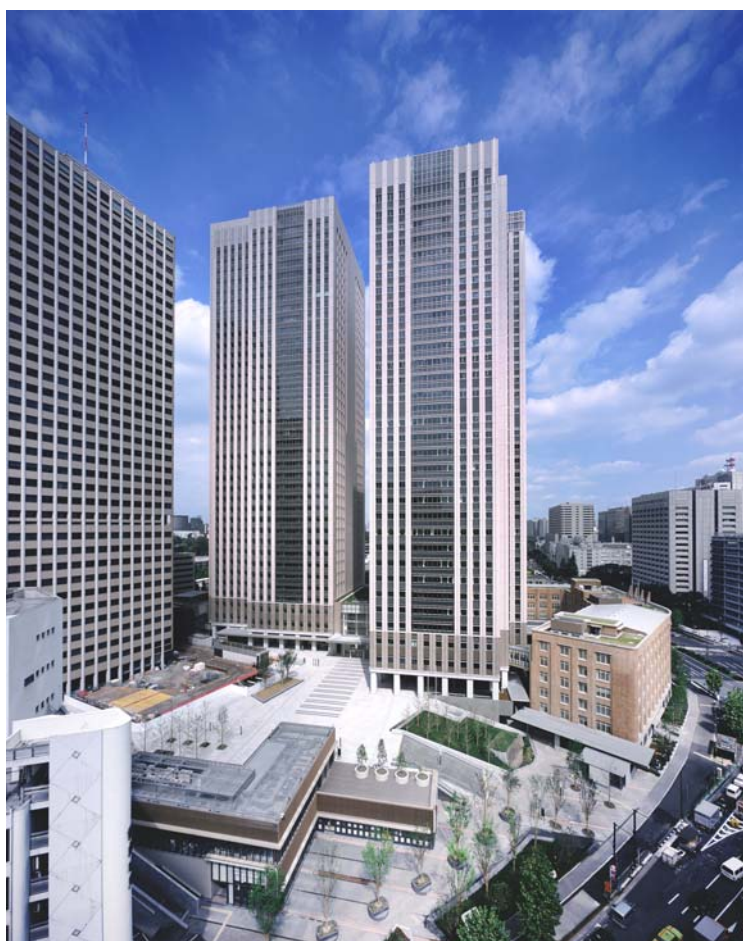
中央合同庁舎第7号館