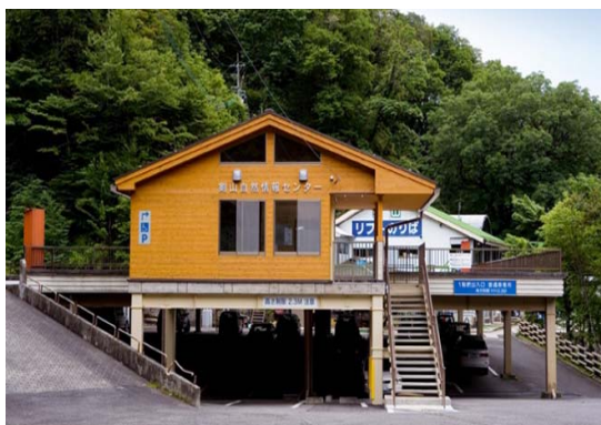
剣山自然情報センター