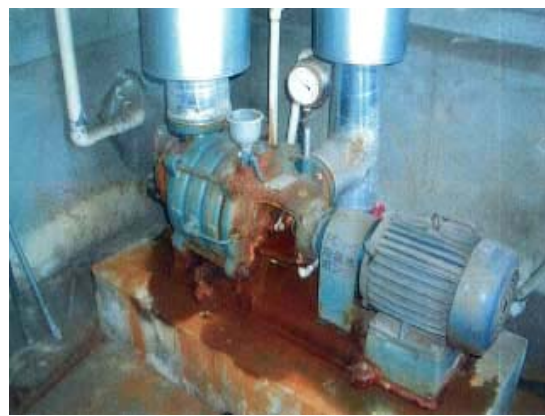
老朽化した空調関係設備

〔空調停止のおそれがあり、更新が必要 (CO 2 排出削減効果の高い機器に更新)〕