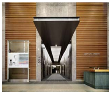
高松サポート合同庁舎 エントランス