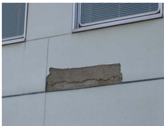
落下した外壁パネル