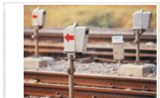
踏切障害物検知装置