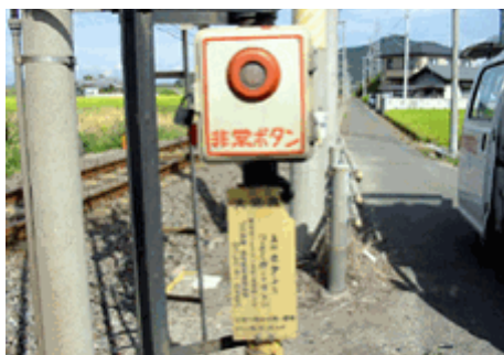
踏切支障押しボタン

踏切支障報知装置:踏切道内で自動車の脱輪やエンスト等により踏切道が支障した場合、踏切支障押しボタン等の手動操作又は踏切障害物検知装置による自動検知により、踏切道に接近する列車に危険を報知するための装置