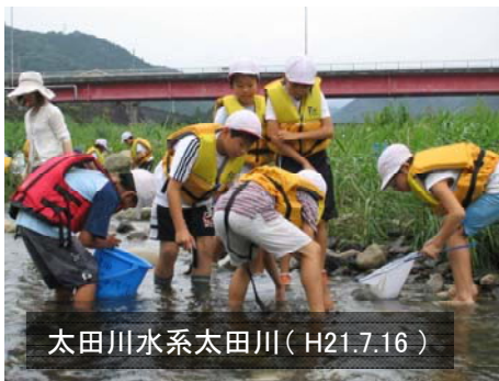
太田川水系太田川(H.21.7.16)