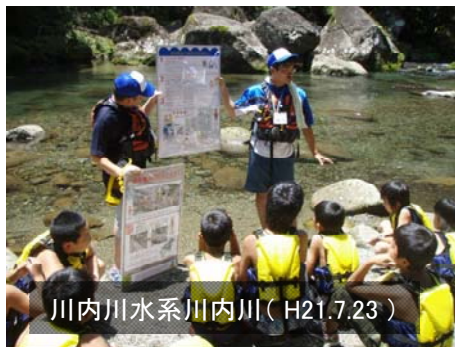
川内川水系川内川(H.21.7.23)