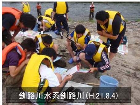
釧路川水系釧路川(H.21.8.4)

平成21年度一級河川の全国水生生物調査では、夏休み期間を中心に、小中学校や市民団体等449団体、15,183人の多数の参加を頂き、567箇所の調査地点数となりました。参加者数の多い都道府県は、北海道、熊本県、宮崎県等でした。