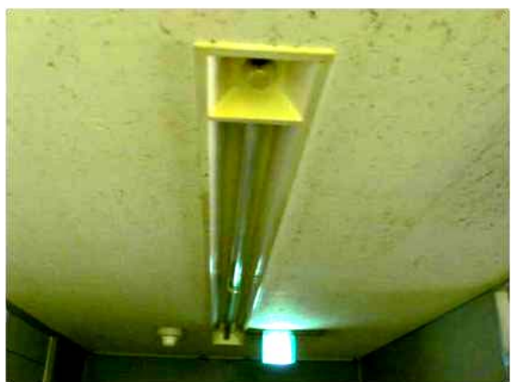
劣化した照明器具

〔漏電等のおそれがあり、照明器具の更新が必要（CO 2 排出削減効果の高いものに更新）〕