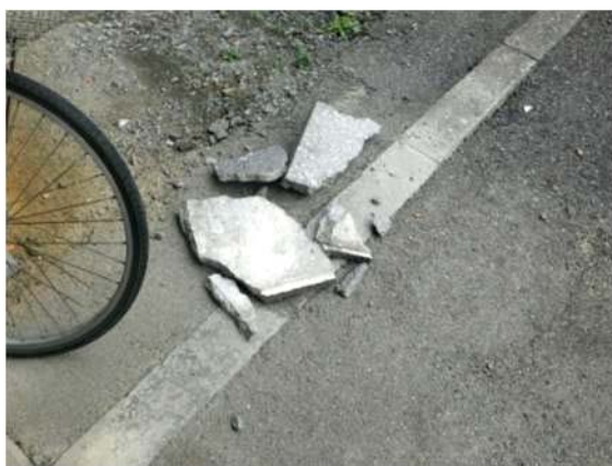
外壁モルタルの落下