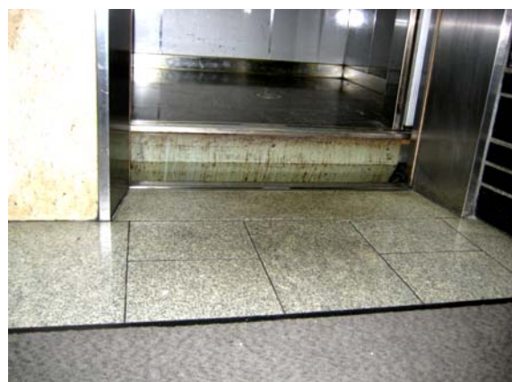
エレベーター着床時の段差