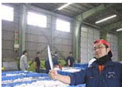
<歯舞ブランドでまちおこしー 「歯舞地区マリンビジョン協議会」>