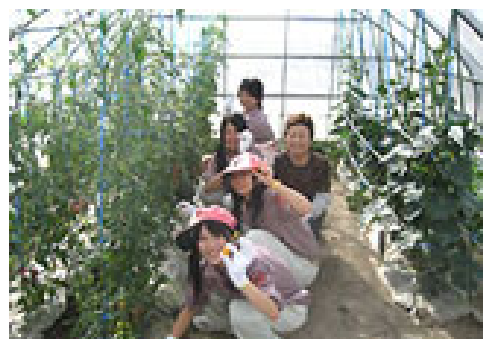
<食育・農作業体験による都市と農村の交流ー 「長沼町グリーンツーリズム運営協議会」>