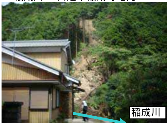
稲成川 田辺市稲成町地内