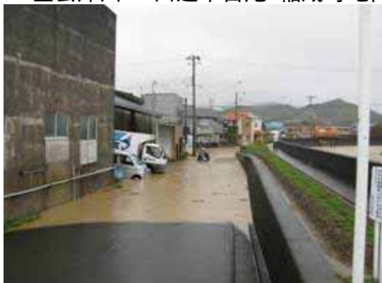
左会津川 田辺市古尾・稲成町地内