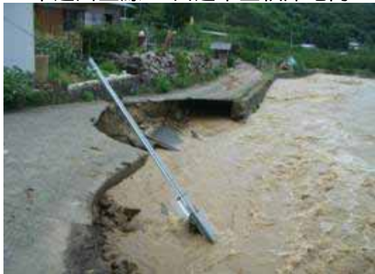
市道川上線 田辺市上秋津地内