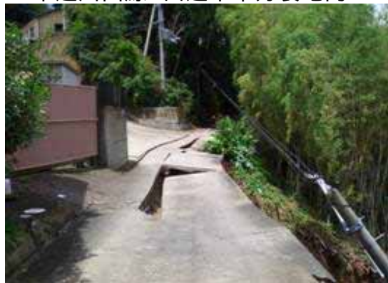
市道川西線 田辺市中芳養地内