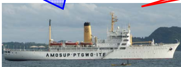
既存練習船による訓練【3か月】