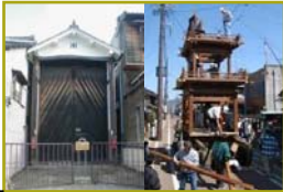
■ 車山蔵と車山の組立て