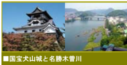
■ 国宝犬山城と名勝木曾川

針綱社の例祭として犬山城下13町内から車山が出されて行われる車山行事では、町衆らによって、車山の組立てから曳き回し、からくり奉納、解体保管を始め、からくりとお囃子の練習や夏の懸装幕の虫干しなど、一年を通じた運営が行われる。370余年もの長い年月の間、町衆らにより大切に守り伝えられてきた犬山祭の祭礼儀式（重要無形民俗文化財）と、その背景または舞台となっている国宝犬山城や城下町の歴史的な町並みが今なお一体となって残り受け継がれている光景が、犬山を代表する歴史的風致といえる。