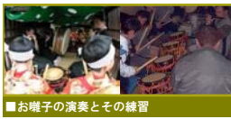
■ お囃子の演奏とその練習