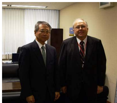
(左:須野原港湾局長、右:ライザネック APSN 理事長)

なお、5月の特別会合は事前に登録をすれば官民を問わずどなたでも参加できます。APSNにご関心のある方は、国土交通省港湾局国際企画室の以下の担当までお問い合わせください。