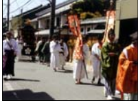
魚屋町での天神祭り