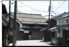
七曲りのまちなみと仏壇職人