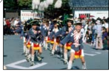
小江戸彦根の城まつり