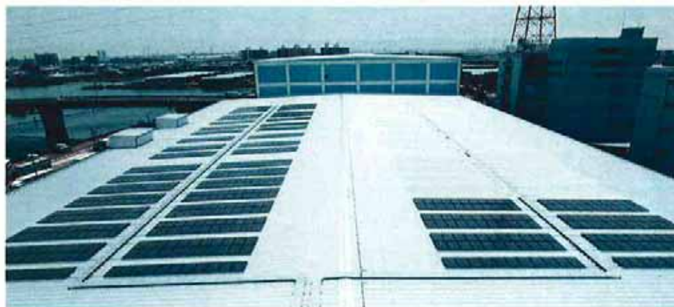
太陽光発電システム