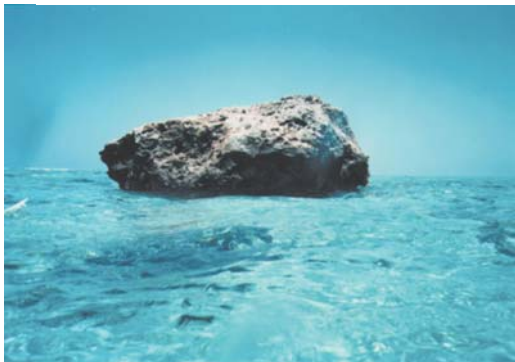
(北小島 昭和62年10月撮影)