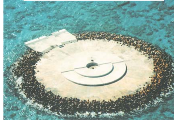
(東小島 護岸工の設置)