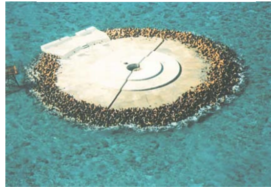
(北小島 護岸工の設置)