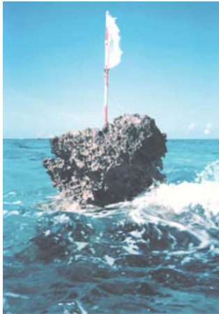
(東小島 昭和62年10月撮影)