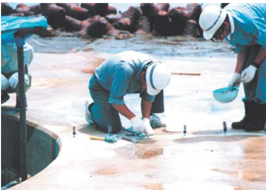
(護岸コンクリートの補修状況)