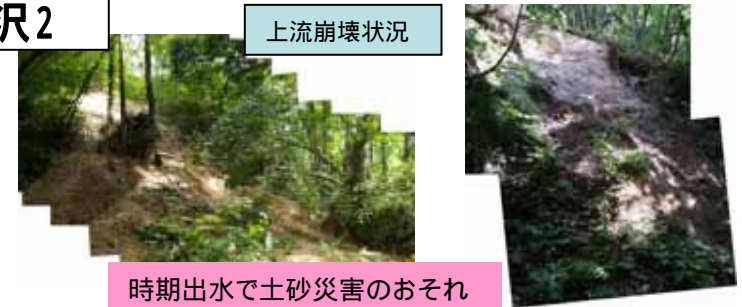
時期出水で土砂災害のおそれ