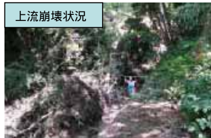
時期出水で土砂災害のおそれ