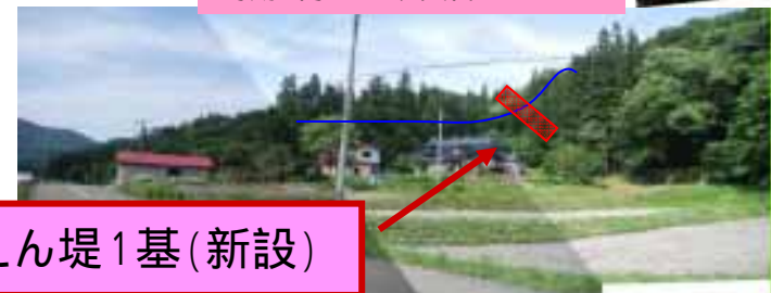
砂防えん堤1基(新設)