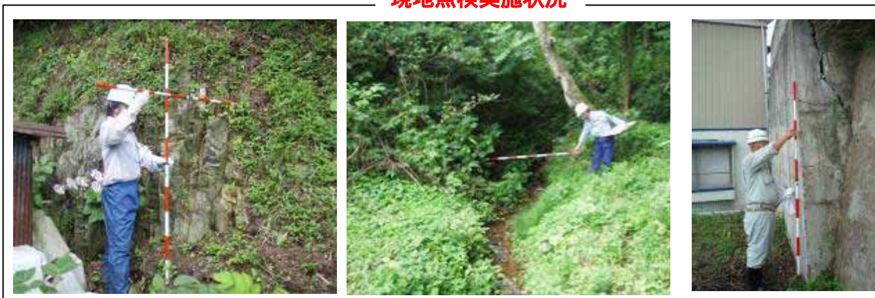
現地点検実施状況