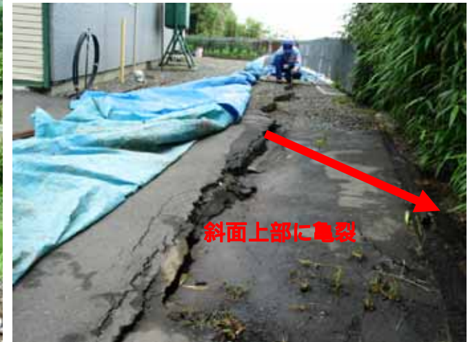
亀裂箇所における雨水浸透防止のためのシート張り