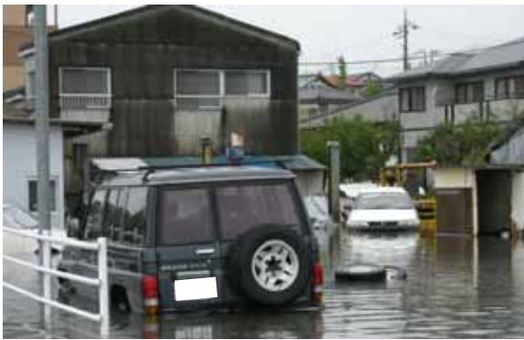
沼川流域の浸水状況(静岡県沼津市)