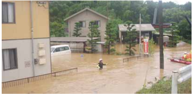
緑川の浸水状況(熊本県甲佐町)