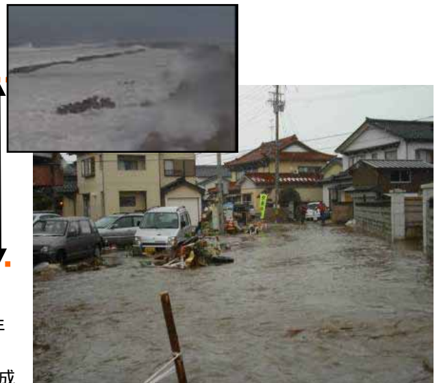
高波被害(平成20年2月24日、入善町芦崎地区)