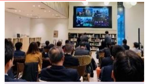
先進的なまちづくりノウハウの水平展開