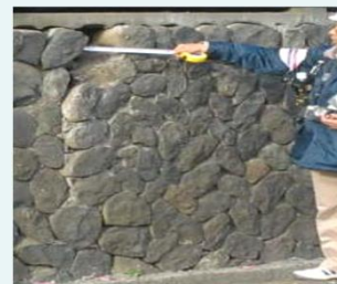
擁壁の危険度調査