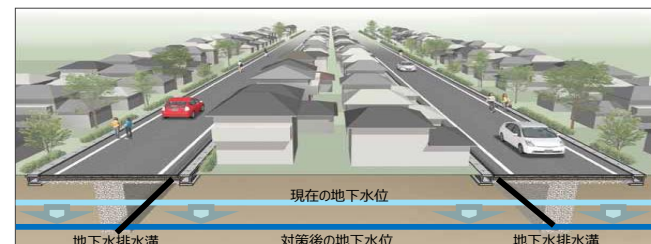
道路と宅地との一体的な液状化対策を行う工法のイメージ（地下水水位低下工法）

宅地と一体的に行われる道路等の公共施設の液状化対策事業に要する費用の一部を補助。