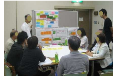
地域住民等との意見交換 (さいたま市)

各施設間の相互利用・共同利用に応じた専用部分や共同利用部分の管理区分や、光熱水費等の会計区分等の明確化や一元化の可否等について検討が必要。