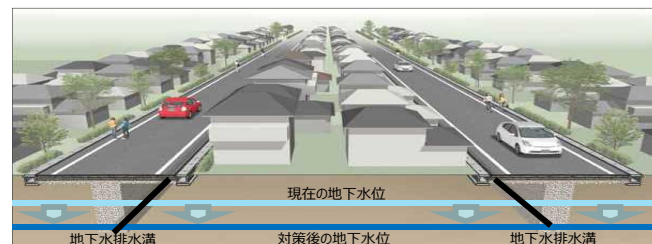
道路と宅地との一体的な液状化対策を行う工法のイメージ（地下水水位低下工法）

宅地と一体的に行われる道路等の公共施設の液状化対策事業に要する費用の一部を補助。