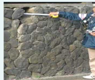
擁壁の危険度調査