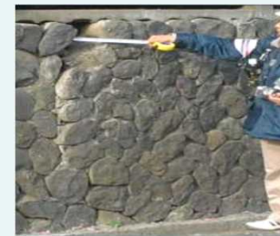
擁壁の危険度調査