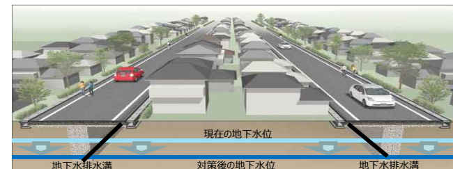
道路と宅地との一体的な液状化対策を行う工法のイメージ（地下水水位低下工法）

宅地と一体的に行われる道路等の公共施設の液状化対策事業に要する費用の一部を補助。