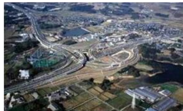
国内初 有料道路コンセッション事業 愛知県有料道路