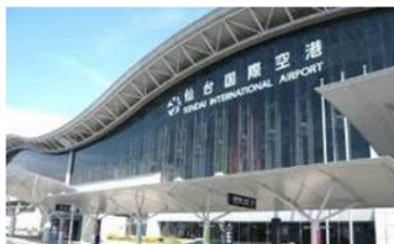
国内初 コンセッション事業 仙台空港