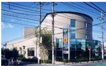
国内初 PFI事業 千葉市消費生活センター