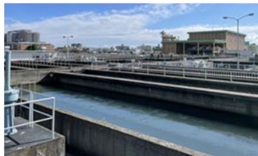
工業用水コンセッション事業 大阪市工業用水道特定運営事業等