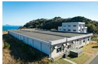
下水道コンセッション事業 三浦市公共下水道(東部処理区)運営事業