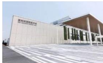
国内初 展示場コンセッション事業 愛知県国際展示場