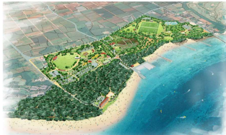
宮古広域公園 (宮古島市)