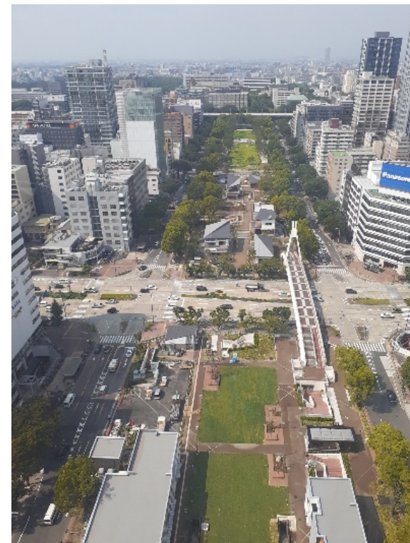
テレビ塔から見た久屋大通公園