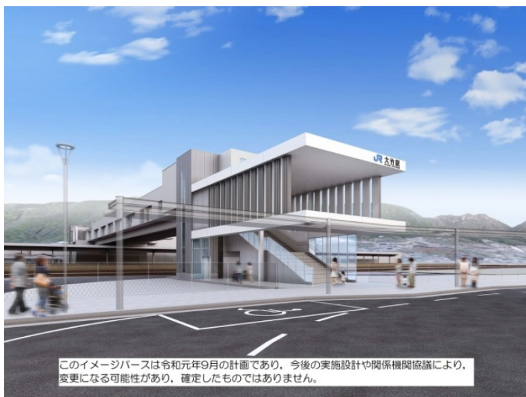
東口交通広場からの外観