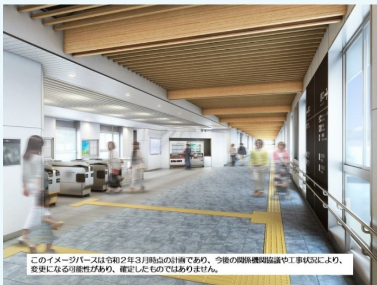
自由通路の内観イメージ