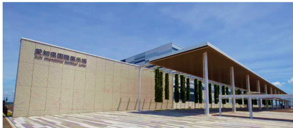
メインエントランス外観