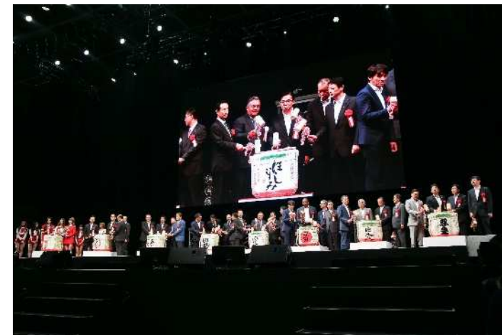
式典での鏡開きの様子