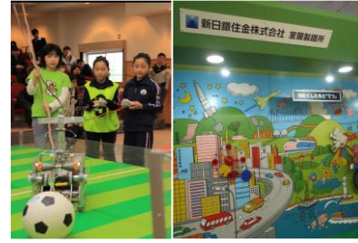
図書館・科学館整備や、室蘭工業大学・新日鐵住金等との産学連携によるコンテンツ充実