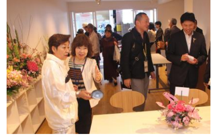
むろらん商店街づくりサポートセンターと連携し、空き店舗活用や創業を支援