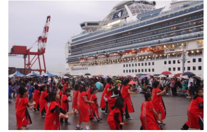
官民連携による客船歓迎事業により広域交流を促進