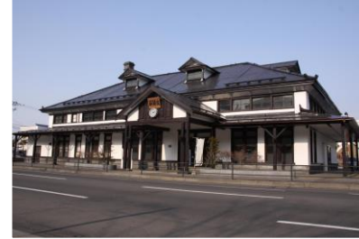
公園整備と一体的に登録有形文化財の旧室蘭駅舎を活用