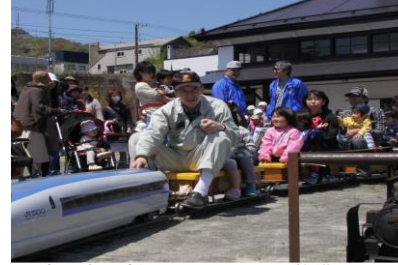
子育て空間創出のための公園整備とミニ新幹線等の子育て応援イベントの実施