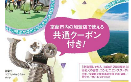
飲食店割引クーポン付冊子発行により地区内の魅力発信や消費を喚起し、回遊性を向上