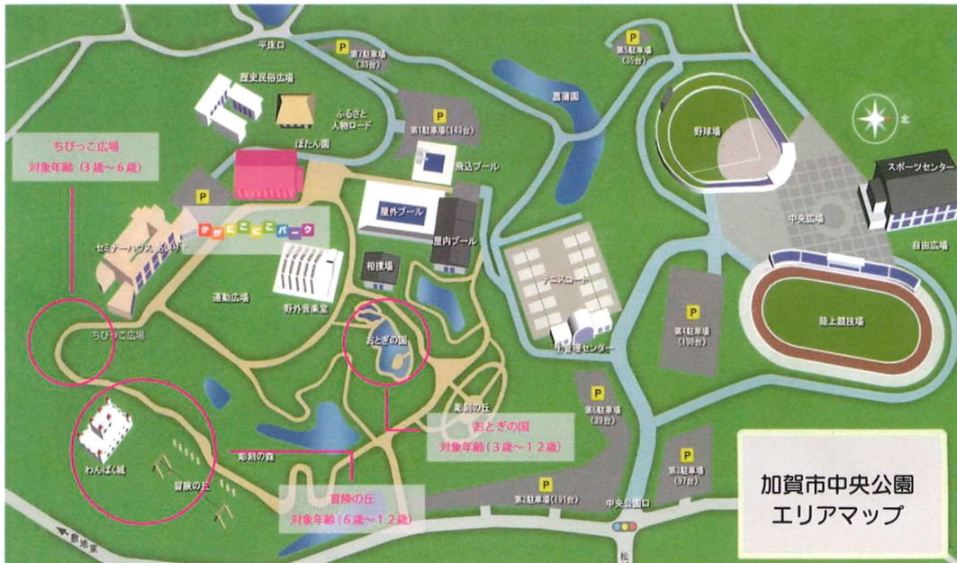
加賀市中央公園 エリアマップ

〒922-0431 利用時間 9:00~17:00 石川県加賀市山田町リ 245 番地 2 Tel : 0761-72-2508 Fax : 0761-72-1258 Mail : kaga-nikopa@abelia.ocn.ne.jp 指定管理者: 加賀市スポーツ振興事業団