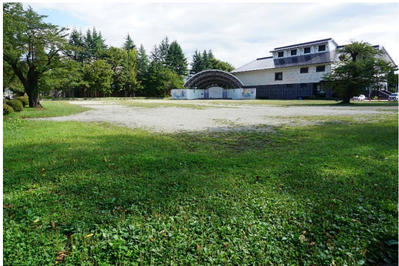
写真①（あじさい広場）