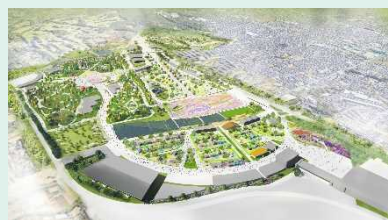
博覧会会場 イメージ