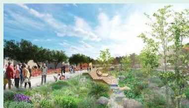
グリーンインフラ実装 イメージ

神奈川県横浜市で開催する2027年国際園芸博覧会は、「幸せを創る明日の風景」をテーマに、花や緑との関わりを通じ、自然と共生した持続可能で幸福感が深まる社会の創造を目的としています。