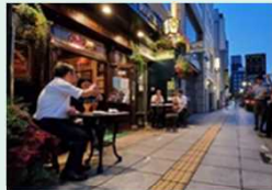
歩道を活用した賑わい創出

今後、にぎわいの森の整備効果を踏まえ、柔軟な資金調達手法を活用した新規事業の立ち上げを目指す。