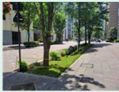
雨庭整備イメージ 事例写真提供：三菱地所(株)

国土交通省総合政策局環境政策課では、重点支援団体としてグリーンインフラに取り組む地方公共団体3地域を決定しました。重点支援団体に対しては、コンサルタントや専門家の派遣等を通じて、計画づくりや推進体制の構築等を支援し、官民連携によるグリーンインフラの実装を加速します。