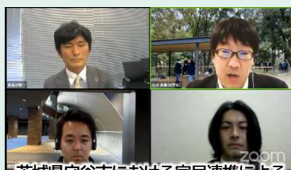
茨城県守谷市における官民連携による 戦略的グリーンインフラ推進プロジェクト (もりやグリーンインフラ推進協議会)