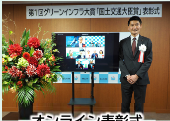
オンライン表彰式