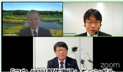
「コウノドリ野生復帰」をシンボル とした自然再生 (兵庫県豊岡市)