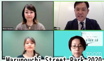
Marunouchi Street Park 2020 (Marunouchi Street Park 実行委員会)