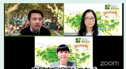
中間支援組織がつなぐ 狭山丘陵広域連携事業 (特定非営利活動法人 NPO birth)