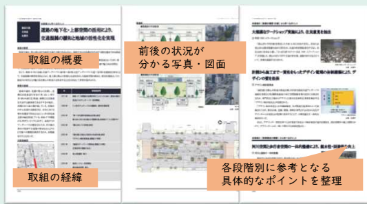
グリーンインフラの取組み事例集（イメージ）