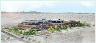
新研修センター外観