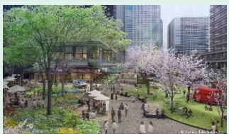
常盤橋タワー先行整備広場