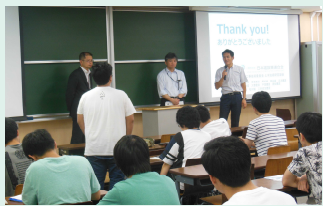
大学での出前講座