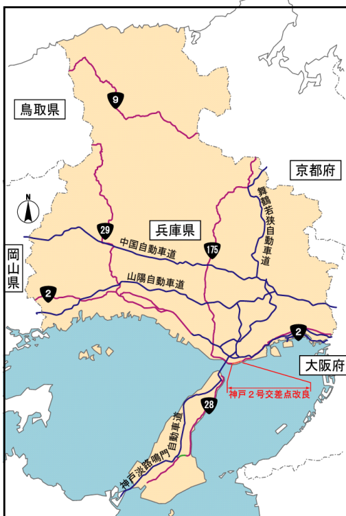
事業概要図 【位置図】