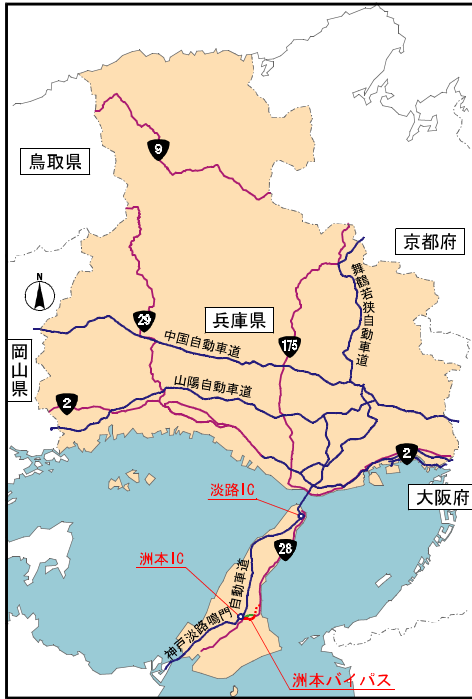
事業概要図 【位置図】