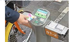
<交通系ICカードでの利用(台湾・台北)>

シェアサイクル利用者の利便性向上を図るため、個人認証、決済に当たって交通系ICカードのワンタッチ利用が可能となるよう、関係機関に対して運用改善を要請する。