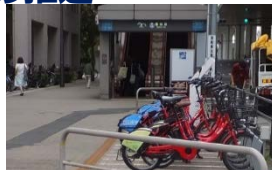
<駅出口への設置(江東区 豊洲駅)>

鉄道駅等の周辺においてサイクルポートの設置を推進するとともに、関係機関に対してサイクルポートの案内サイン設置を要請する。