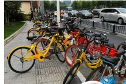
<放置されたシェアサイクル(中国・北京)>

シェアサイクルの普及促進のため、関係府省庁による検討会を設置し、事業の規制の必要性や支援の在り方等について検討する。