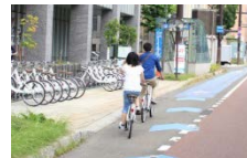
<ポート近くの自転車通行空間の整備事例(札幌市)>

公共交通を補完する交通システムとして、シェアサイクルの安全性及び快適性を向上するために、サービス提供エリアにおける自転車通行空間の整備を促進する。