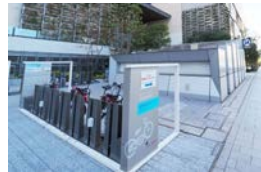
<公開空地への設置(横浜市)>

サイクルポート設置の促進を図るため、路上や既設駐輪場等の公共用地や公開空地、コンビニ等の民有地へのサイクルポート設置の在り方について、関係者と連携しつつ検討する。