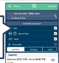
<シェアサイクルを含んだ経路検索検索アプリ(フランス・パリ)>

経路探査に利用する交通機関を選択 ・地下鉄 ・バス・トラム ・シェアサイクル(Velib')