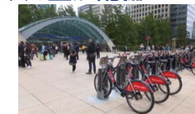
<ターミナル駅の大規模ポート(イギリス・ロンドン)>

関係する地方公共団体と連携し、オリンピック・パラリンピック競技大会までにサイクルポートの高密度化、駅等の拠点における貸出自転車の重点配備を実施する。