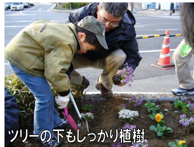
ツリーの下もしっかり植樹