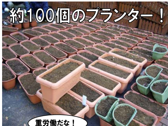
約100個のプランター!