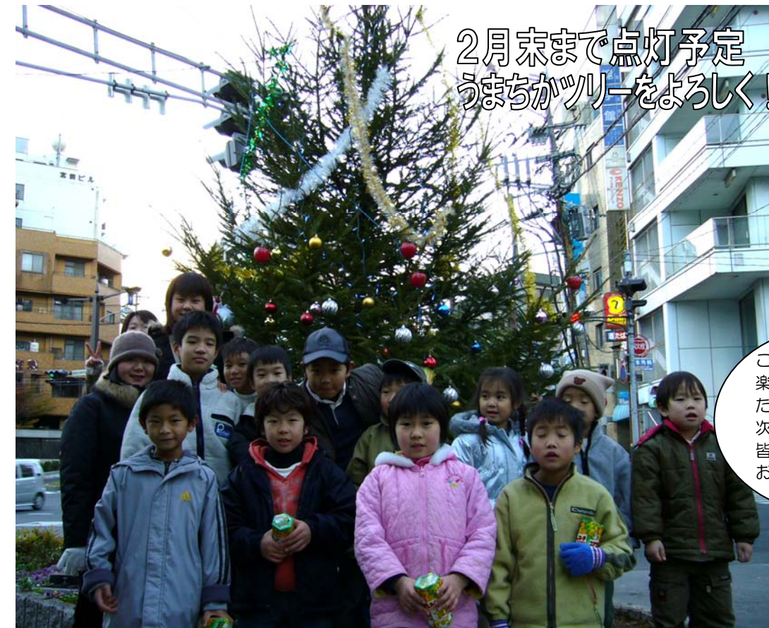
2月末まで点灯予定 うまちかツリーをよろしく!