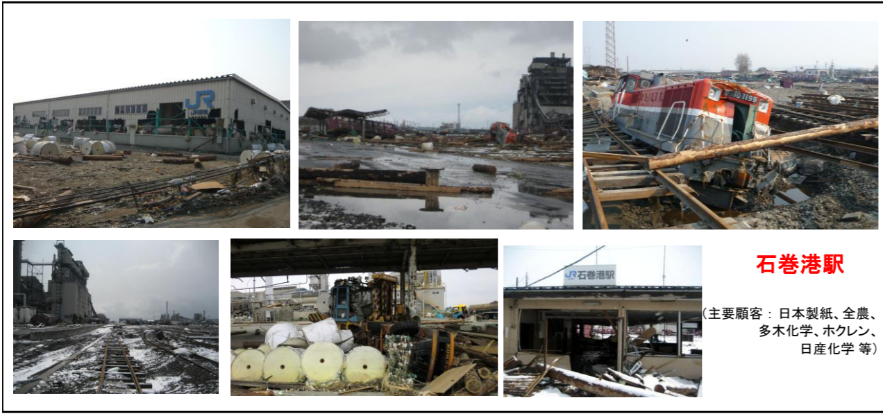
石巻港駅 (主要顧客：日本製紙、全農、多木化学、ホクレン、日産化学等)