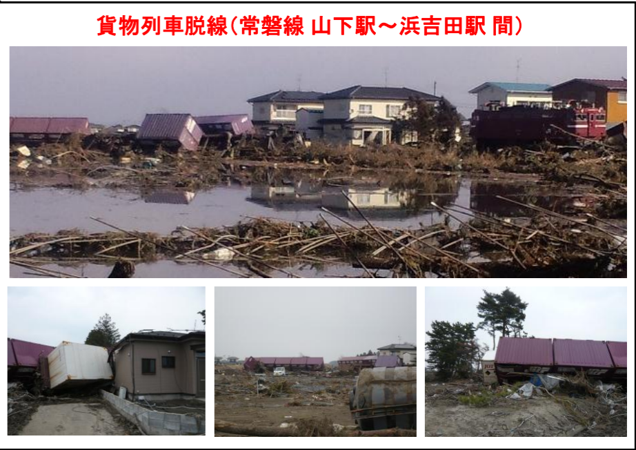
貨物列車脱線(常磐線 山下駅～浜吉田駅間)