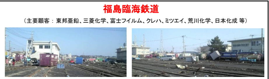
福島臨海鉄道 (主要顧客：東邦亜鉛、三菱化学、富士フィルム、クレハ、ミツエイ、荒川化学、日本化成等)