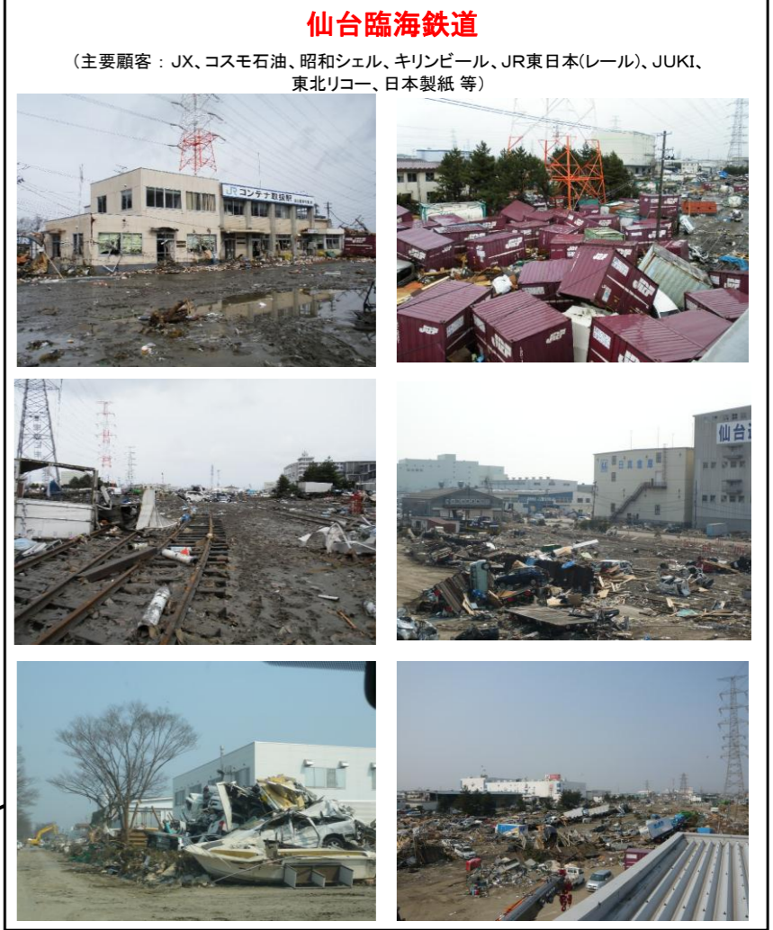
仙台臨海鉄道 (主要顧客：JX、コスモ石油、昭和シェル、麒麟ビール、JR東日本(レール)、JUKI、東北リコー、日本製紙等)