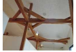
<道の駅の耐震対策>