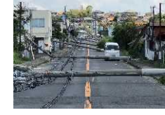
<電柱倒壊による道路閉塞>

電柱倒壊の危険性の高い市街地の緊急輸送道路の区間で、災害拠点へのアクセスルートで事業実施環境が整った区間について、無電柱化を実施。