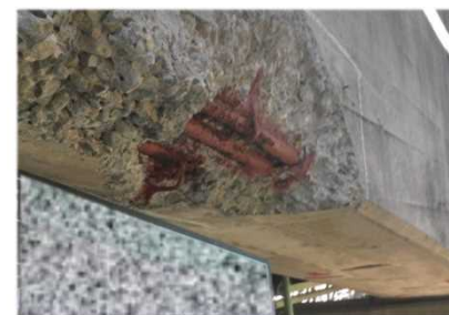
損傷状況(鉄筋露出)