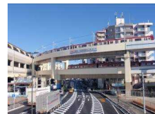
<連続立体交差事業>