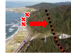
<ネットワーク整備>