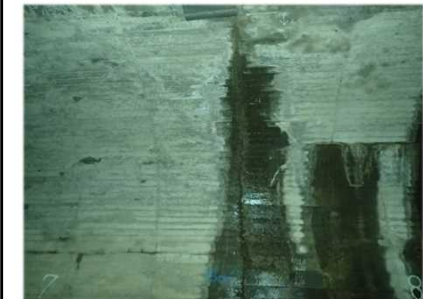
損傷状況(うき・漏水)