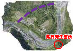
<危険箇所を回避するミニバイパス>