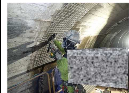
修繕の様子(剥落対策)