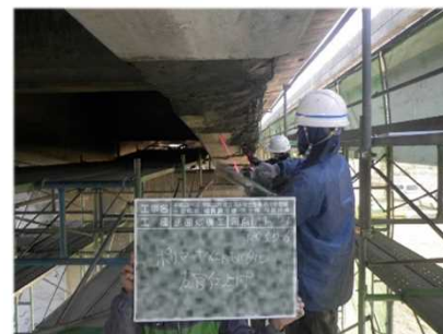
修繕の様子(断面修復)