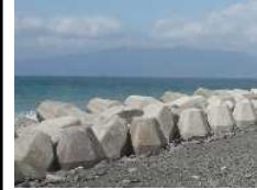
<消波・根固ブロック>

越波・津波の危険性のある消波ブロック整備等の越波防止対策、ネットワーク整備による越波・津波に係る対策を実施。