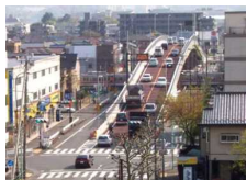
<単独立体交差事業>

救急活動や人流・物流等に大きく影響を与える可能性がある踏切について、長時間遮断時に優先的に開放する踏切への指定等や立体交差化等を実施。