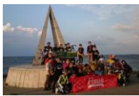
モニターツアーの実施