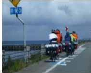
(矢羽根型路面表示設置箇所の走行状況)