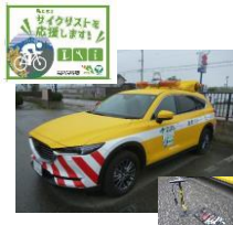
サイクリスト応援カーによる工具等の無料貸出