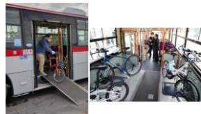
移動サポート(サイクルバス)による輪行サービス