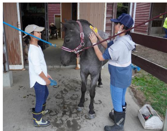
動物とのふれあい（粟島：新潟県粟島浦村）

※国土交通省では、離島振興に資する取組として、離島活性化交付金を通じて離島留学に係る受入体制の充実等、自治体の取組を支援しています。