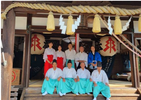
地域行事への参加（魚島：愛媛県上島町）