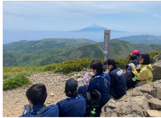
礼文岳登山（礼文島：北海道礼文町）