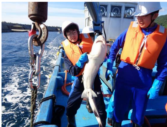
大罾網体験（佐渡島：新潟県佐渡市）