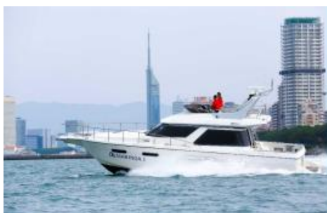
(体験クルーズの様子)

各地域におけるイベントの詳細は各運輸局のHP等をご確認ください。「海の駅フェスタ」へはプレジャーボートの係留施設を利用しない方もご参加いただけます。地元の皆様、観光客の皆様も是非、足をお運びください。